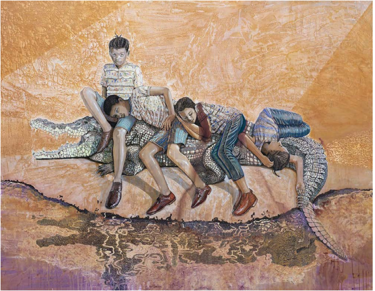
«Temps modernes II », 2019. Acrylique sur toile 190×240 cm.